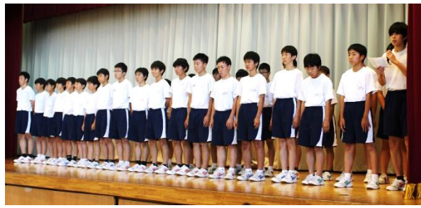
陸 上 大 会 激 励 会

1学期は行事が多く、忙しい時期でしたが、一つ一つ真面目に取り組むことができたので、良かったなと思いました。3年間の中で一番大きな行事の修学旅行では、班のみんなやクラス・3年生全員で協力し、良い修学旅行にできたことが、とても良かったなと思いました。