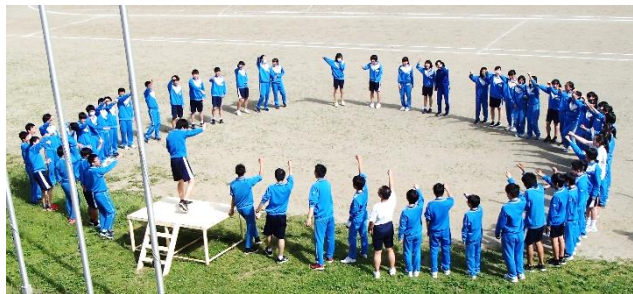
中総3 体年 前生 の 円陣

71日間の1学期は、多くの生徒が大きく成長することができた、充実した1学期だったと思います。今回の学校だよりは、各学級代表の1学期の感想と、22日から始まる県大会代表生徒の抱負を中心に、吹奏楽部の地区大会金賞・県大会出場など、様々な内容を拡大版でお届けしたいと思います。