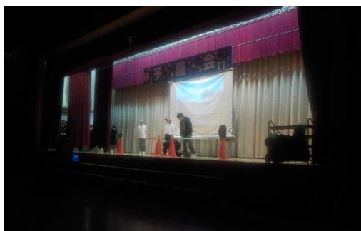
1年生の出し物 劇「君の名は」の様子

2月17日（金）に、「予餞会」が開催されました。3年生に楽しんでもらえるよう、1、2年生は冬休み中から企画し、3年生への感謝の気持ちをどのように伝えたら良いのか考え、準備を進めてきました。当日は、各学年から、歌やダンス、劇などが披露されました。また、各部の部長からは、感謝の言葉などが贈られました。また、3年間を振り返るスライドショー、先生方からのビデオレターが上映されました。そして、最後には、3年生からも1、2年生に向けて合唱が披露され、とても感動的な合唱でした。1、2年生と3年生のお互いの気持ちが伝わる予餞会となりました。