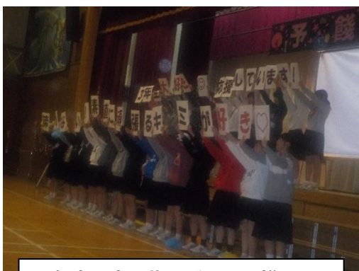
2年生の出し物 ダンスの様子