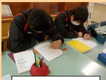
学習会の様子 3年生

冬休み中の4日間、午前の部は9時から12時まで、午後の部は13時から15時までの時間帯で、図書室にて行われました。冬休みの宿題や持参した課題に、1年生から3年生が真剣に取り組んでいました。特に入試を控えている3年生の参加が多くみられ、わからない問題等を学習支援員さんに積極的に聞くなどしていました。冬休み中の学習会は終わりますが、三学期は毎週木曜日の放課後に学習会を継続していく予定です。