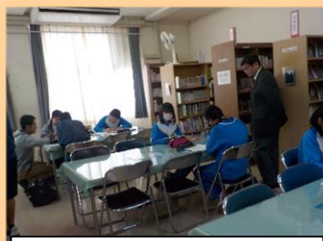
学習会の様子 1~3年生