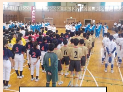
新人戦激励会の様子