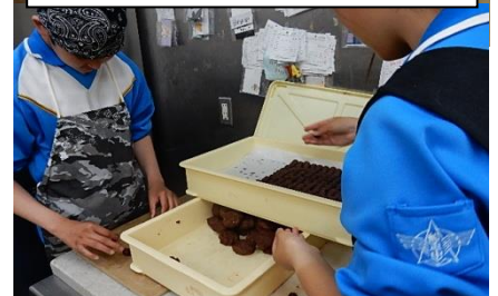
マーブルマーブル(菓子店)での様子