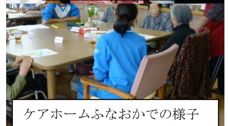
ケアホームふなおかでの様子