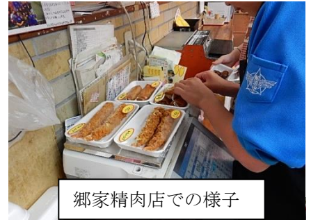
郷家精肉店での様子