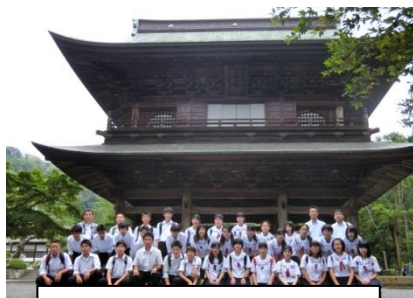
円覚寺で3年1組写真