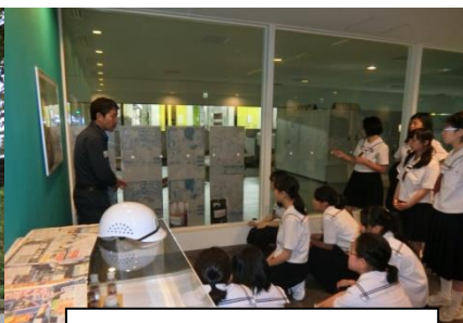
産経新聞工場見学の様子