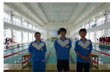
水泳大会に出場した3人