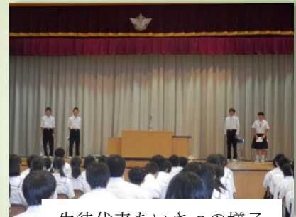
生徒代表あいさつの様子