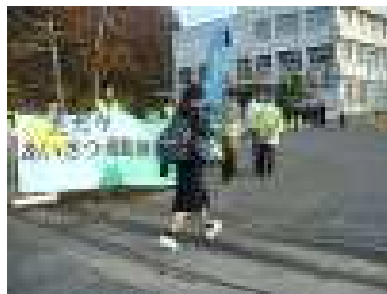
町民会議の皆さん