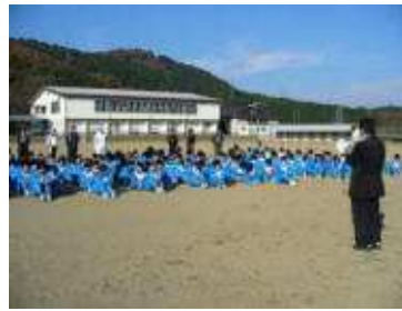
全体指導のようす