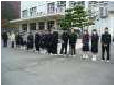
中央委員会のメンバー

「青少年のための柴田町民会議」の方々が朝早く学校にお見えになり、生徒の登校に合わせて「あいさつ運動」を行いました。本校からも、生徒会役員と中央委員会のメンバーが参加し、登校してきた生徒に大きな声であいさつをしていました。とても冷え込んだ朝でしたが、元気なあいさつに身も心も温かくなりました。この運動は、12月19日と来年1月にも行う予定です。