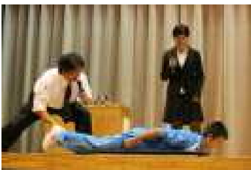
練習用スケルトンの体験試乗