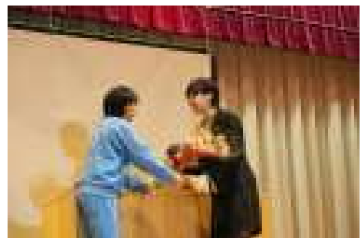
感謝の気持ちを花束にして贈呈しました